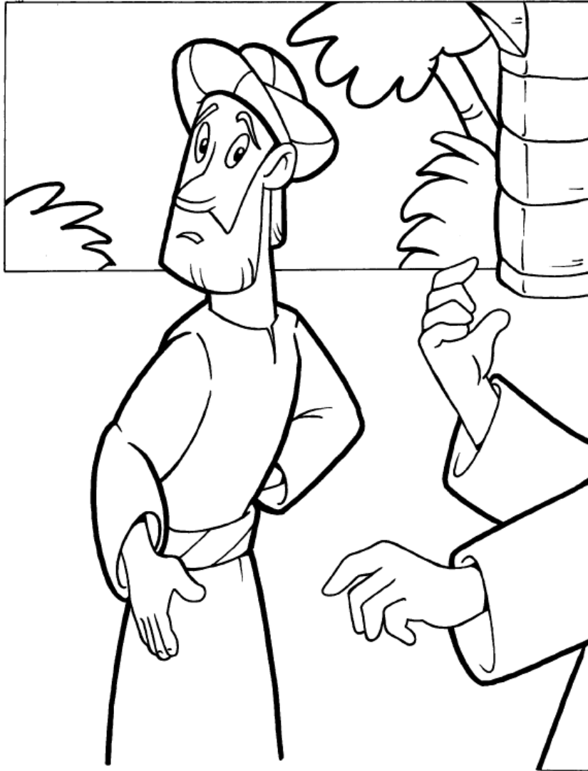
EL JOVEN RICO