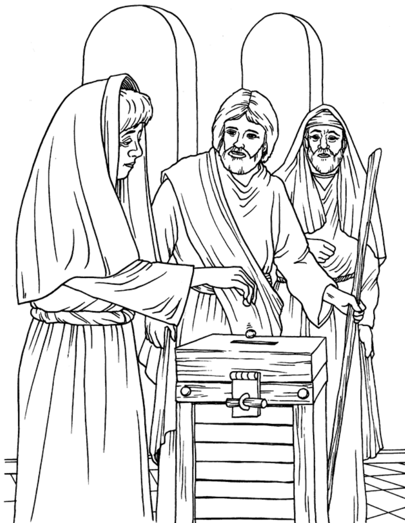
La ofrenda de la viuda Marcos 12:41-44

Cada número representa una letra del alfabeto. Sustituye cada letra por el número correspondiente para resolver las palabras secretas.