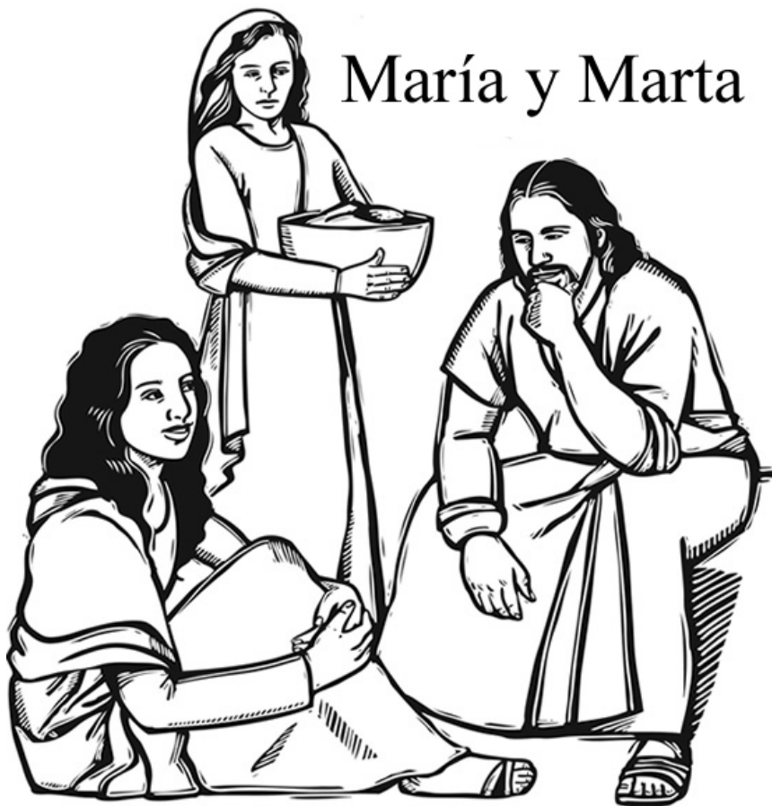
Jesús en casa de Marta y María

—Señor, ¿no te importa que mi hermana me haya dejado sirviendo sola? ¡Dile que me ayude! Lucas 10:40