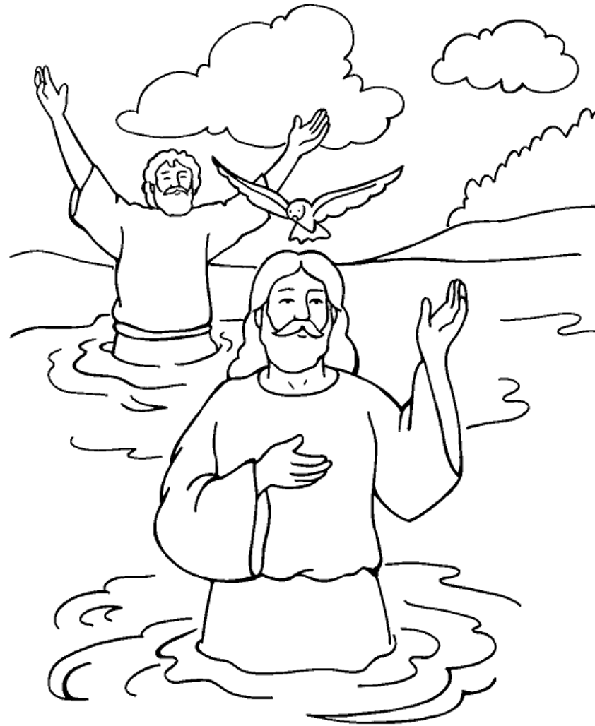
Juan bautiza a Jesús

From Thru-the-Bible Coloring Pages for Ages 4-8. © 1986,1988 Standard Publishing. Used by permission. Reproducible Coloring Books may be purchased from Standard Publishing, www.standardpub.com, 1-800-543-1301.