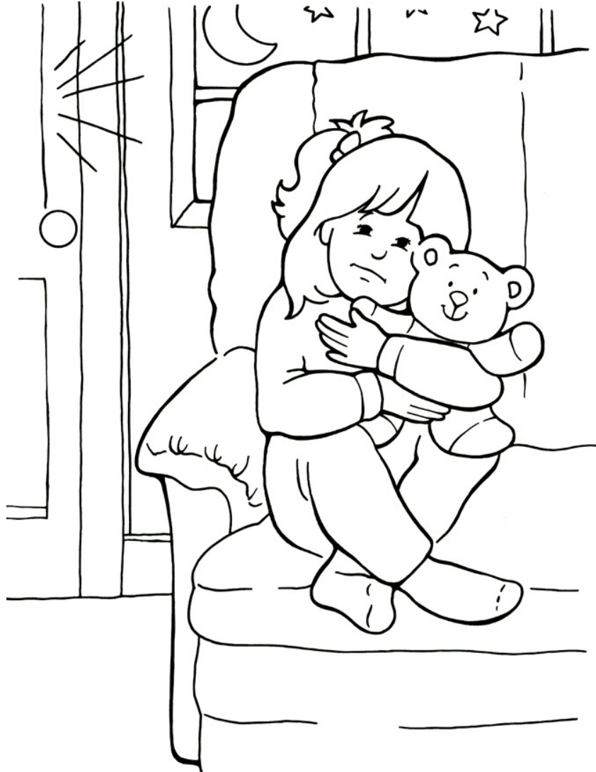
Jesús es conmigo cuando tengo miedo.