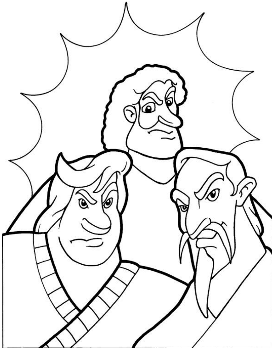
Parabola de los labradores malvados Mateo 21:33-45