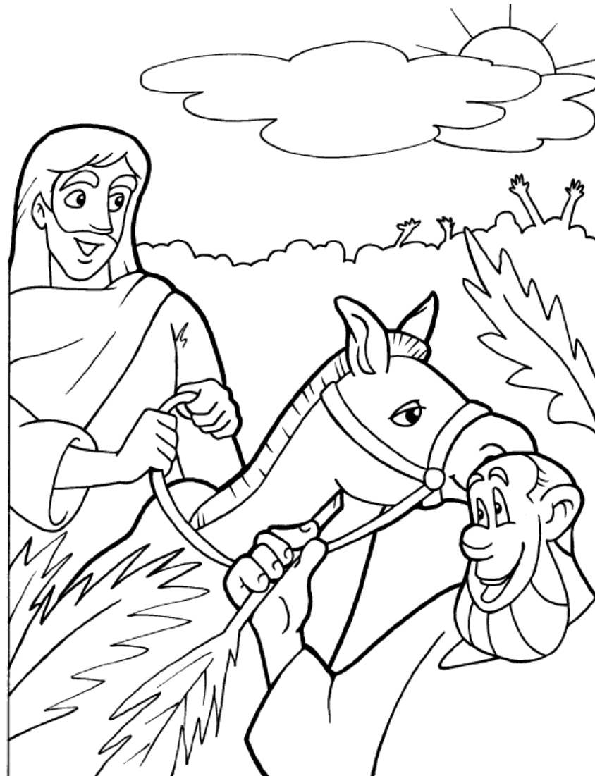
LA ENTRADA TRIUNFAL