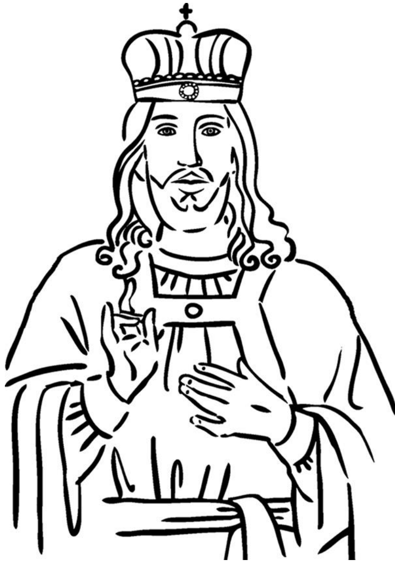
CRISTO REY Juan 18:33-37