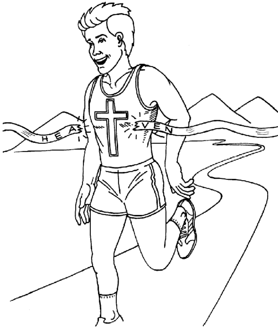
Corre la Carrera