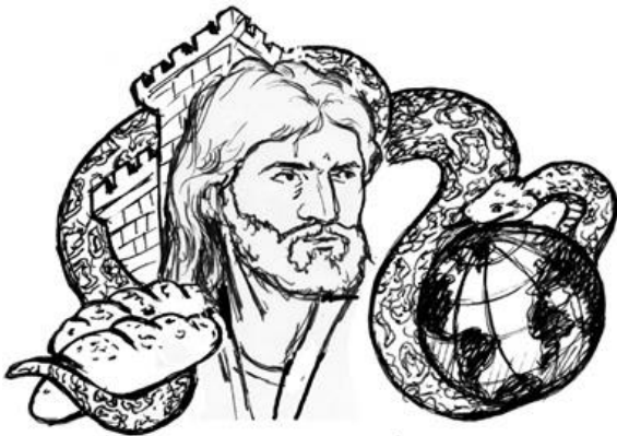
Tentación de Jesús