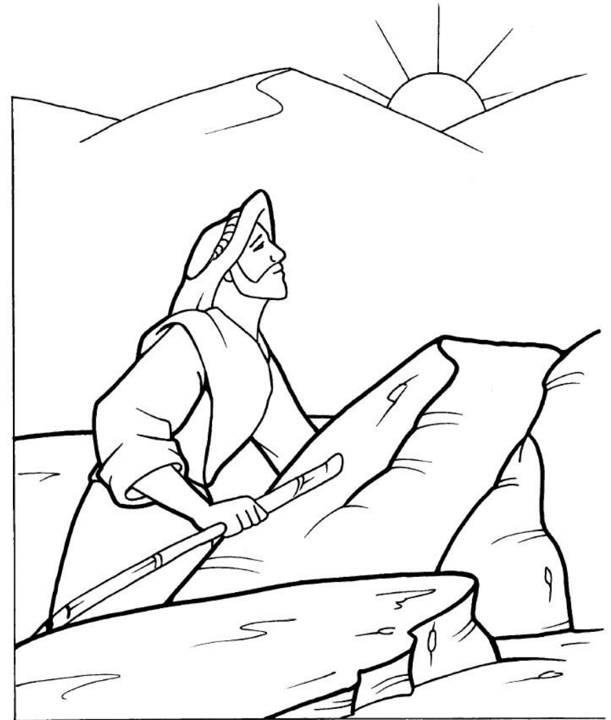
Tentación de Jesús