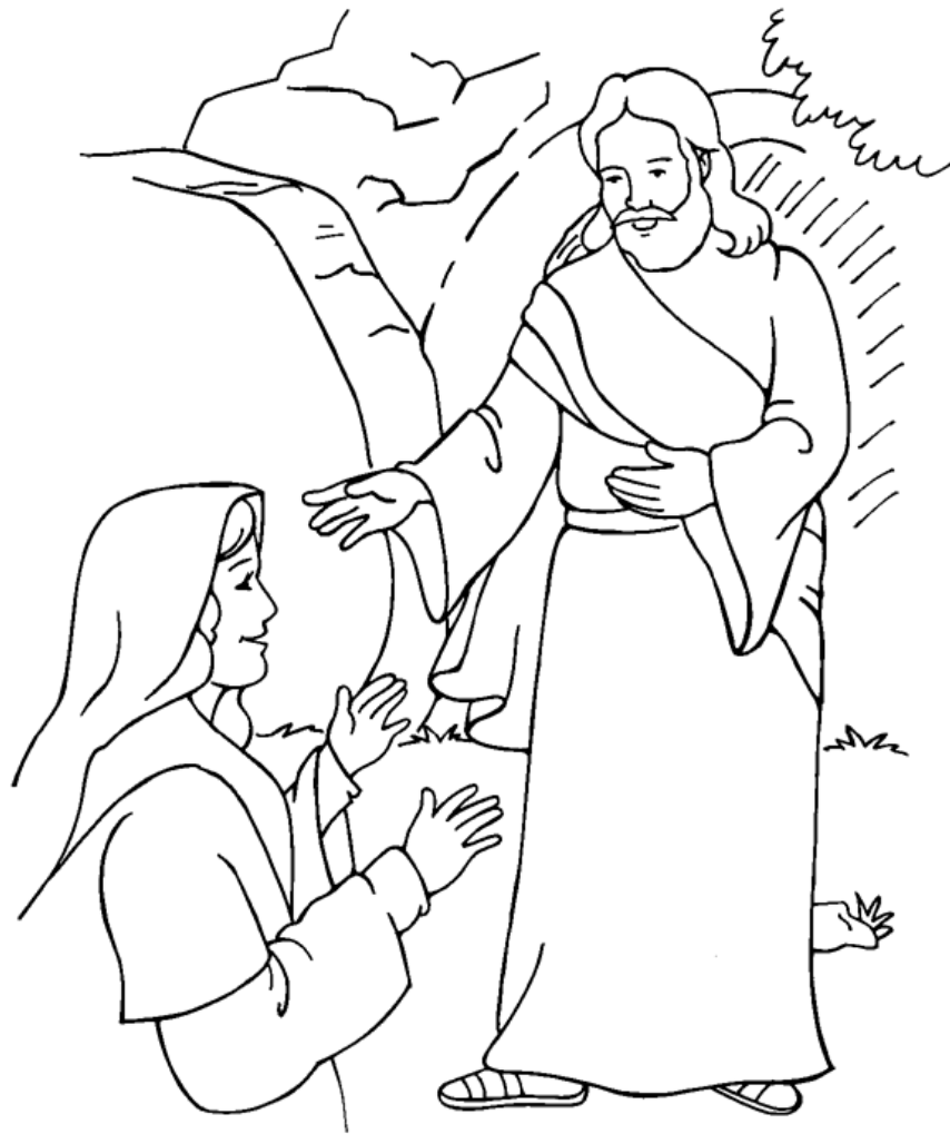
Jesús se aparece a María Magdalena

¿Puedes ayudar a María a encontrar el camino a la tumba vacía?