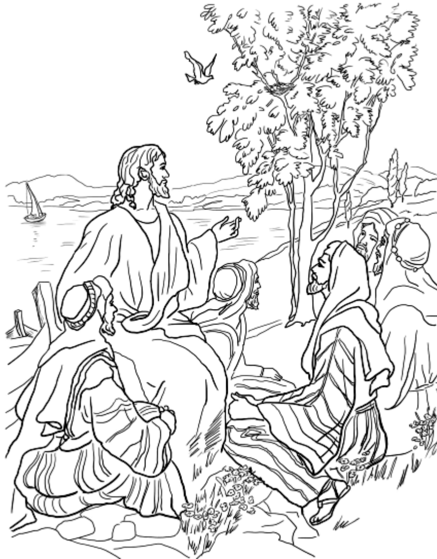
La parábola de la semilla de mostaza Marcos 4:30-34

Cada número representa una letra del alfabeto. Sustituye cada letra por el número correspondiente para resolver las palabras secretas.