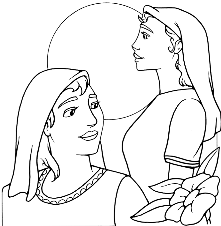
Lea y Raquel

Labán tenía dos hijas. La mayor se llamaba Lea, y la menor, Raquel. Génesis 29:16 (NVI)