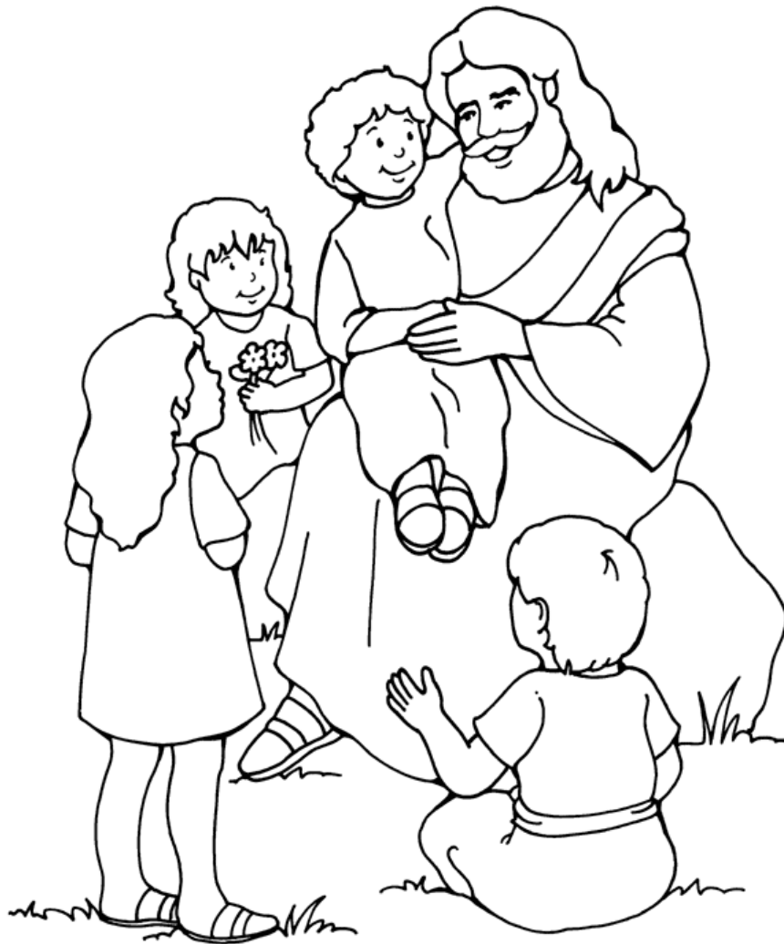
Jesús y los niños

Conecte los puntos para completar la imagen.