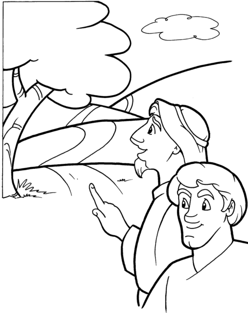
El camino a Emaús