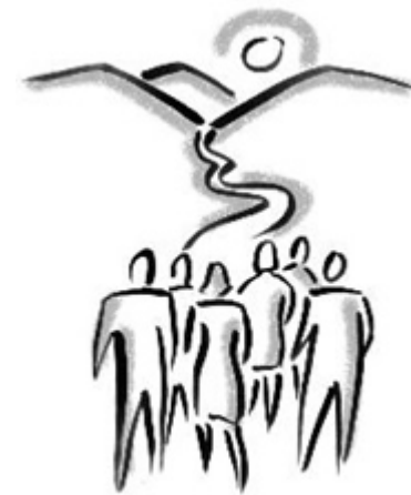
El camino a Emaús