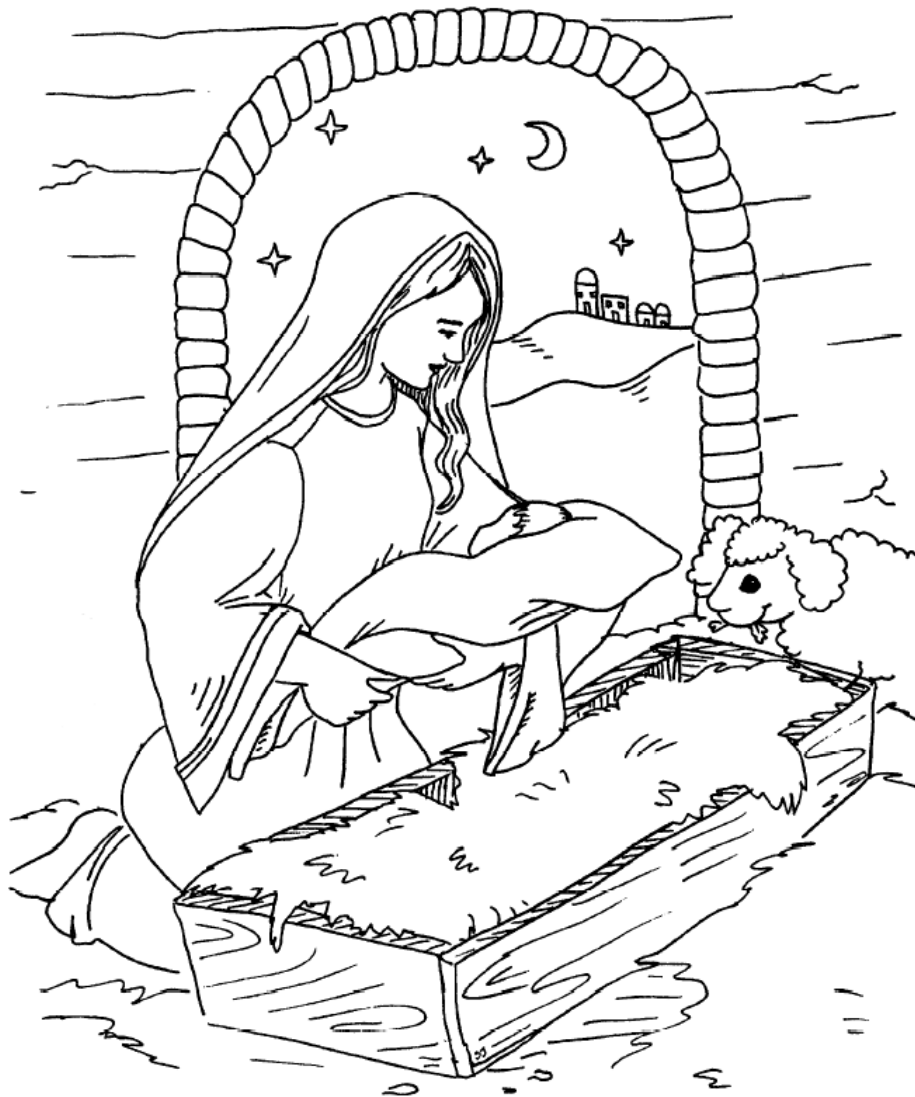
Nacimiento de Jesús Lucas 2:1-20