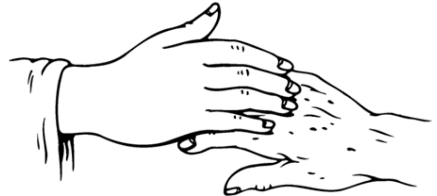
Jesús sana a diez leprosos