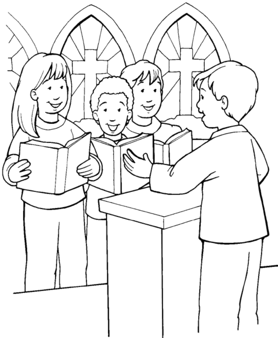
La Verdadera Adoración