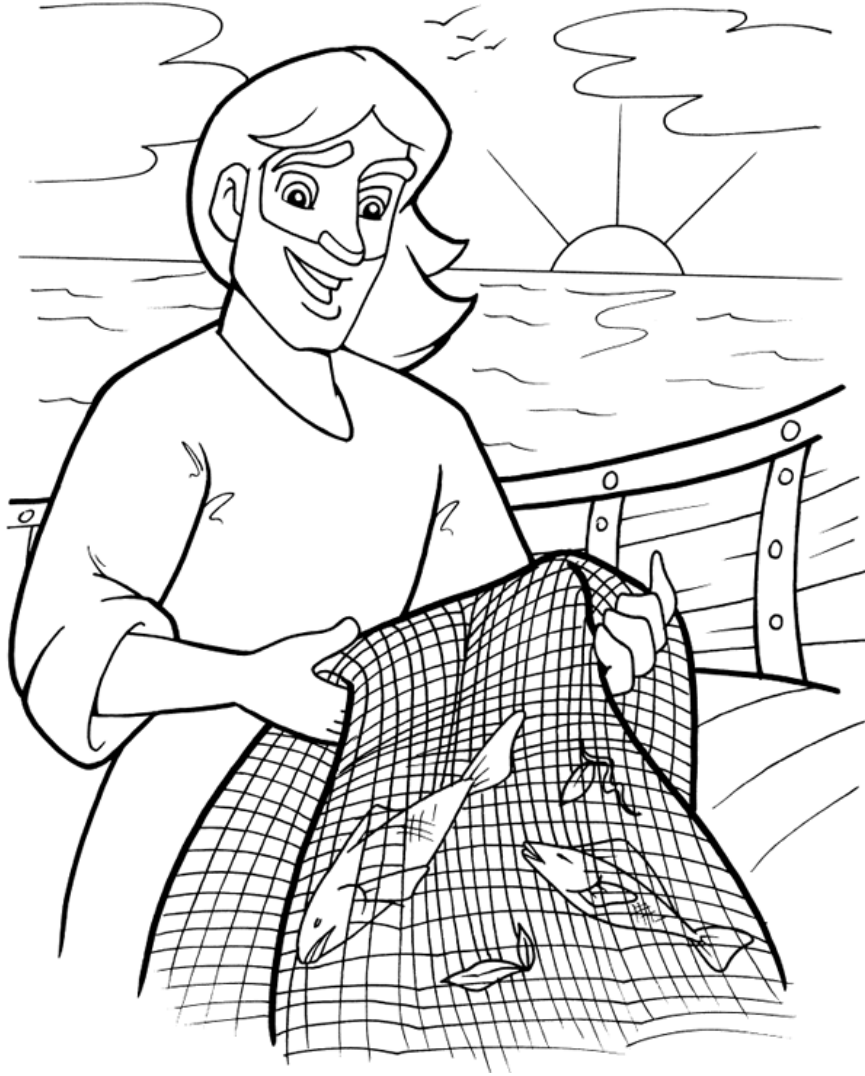
Pescador de hombres

Cada número representa una letra del alfabeto. Sustituye cada letra por el número correspondiente para resolver las palabras secretas.