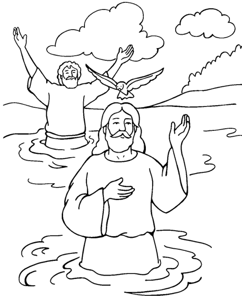
Juan bautiza a Jesús Mateo 3, Marcos 1, Lucas 3

Cada número representa una letra del alfabeto. Sustituye cada letra por el número correspondiente para resolver las palabras secretas.