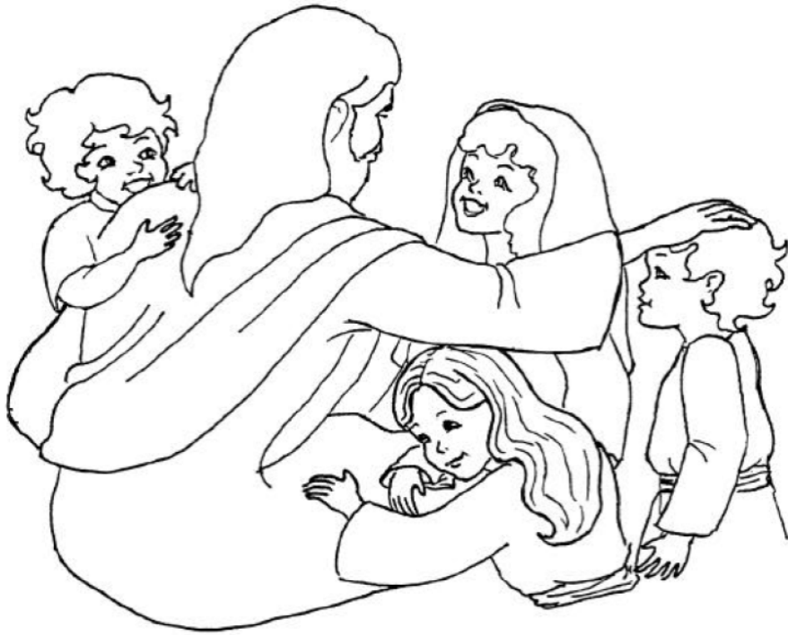
Jesus and the Children