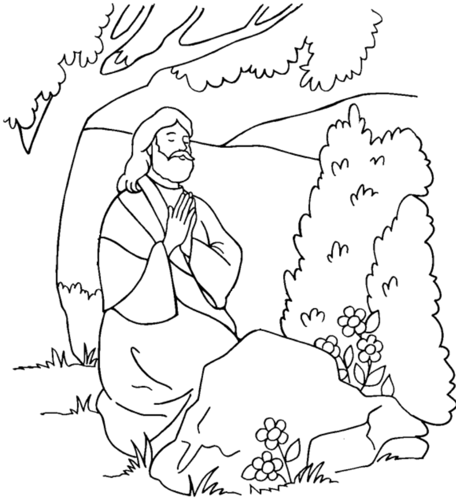
Jesús ora por sus discípulos

From Thru-the-Bible Coloring Pages for Ages 4-8. © 1986,1988 Standard Publishing. Used by permission. Reproducible Coloring Books may be purchased from Standard Publishing, www.standardpub.com , 1-800-543-1301.